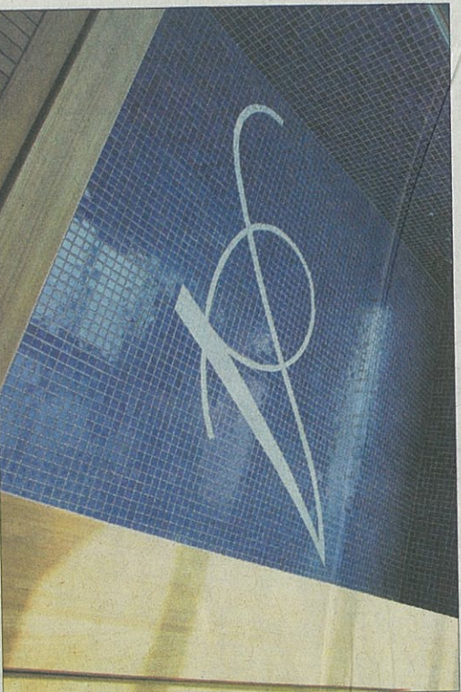
De bodem van het zwembad.