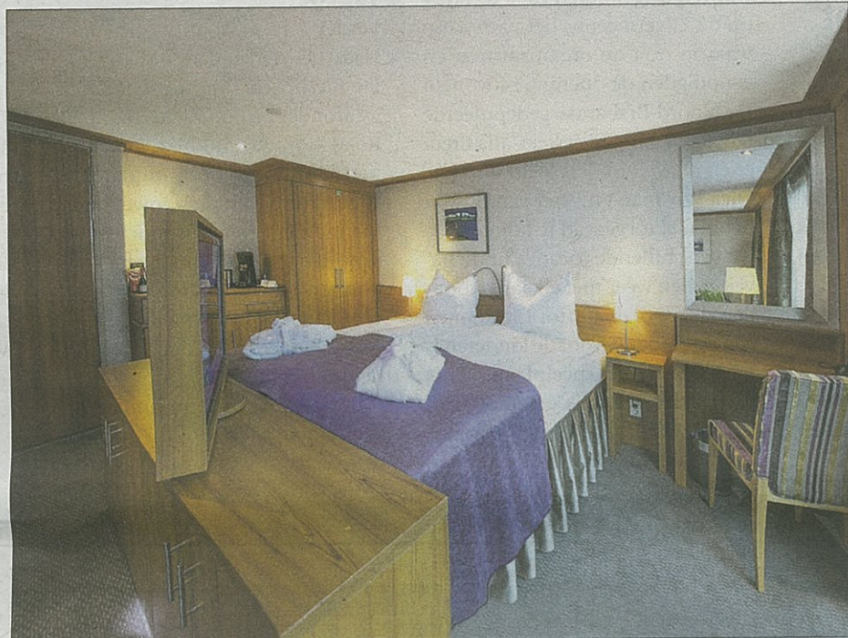
Een van de 92 cabines.

relddelen komen steeds jongere gasten naar onze luchthavens om van daaruit éénmaal de koffers aan boord te zetten voor een comfortabel verblijf in een varend vier+ sterrenhotel dat je langs de mooiste plekjes van Europa brengt. Vantage heeft als touroperator een geweldige naam in de markt en niet alleen voor river cruises. "Je kan met hen evengoed op safari of de ijsberen gaan bekijken op Alaska", grapt hij. Hun klanten zijn zeer tevreden en 'merktrouw' en dat is heilig voor Vantage. "Zo sterk dat ze een absolute voor-