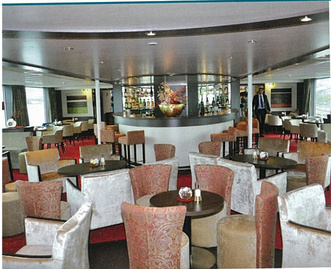
„räumig präsentiert sich die Bar auf dem Mozart-Deck