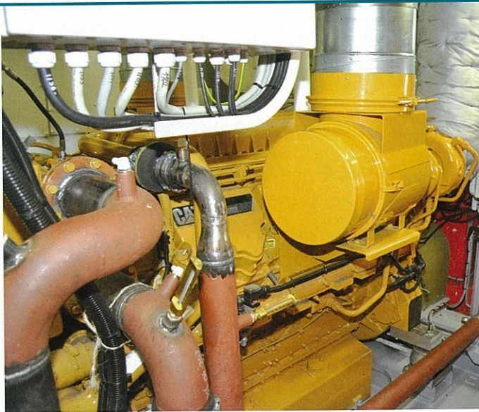
Die beiden Caterpillar-Hauptmaschinen leisten je 746 kW